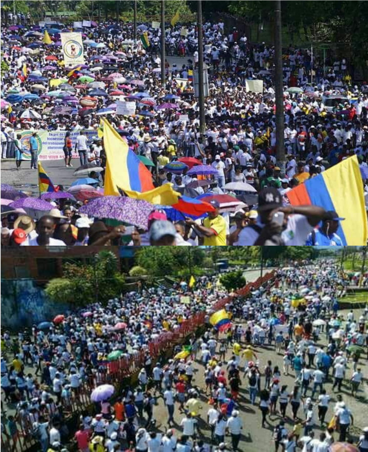
Movilización de comunidad de Buenaventura día 17 de Mayo de 2017.